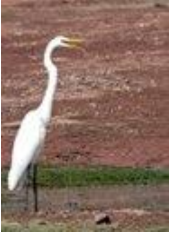
Grande Aigrette (ardea alba) en ballade au Nord de Russell !!