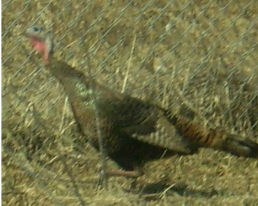
Une magnifique dinde sauvage côtoie le grillage autour de la carrière au Nord de Russell.