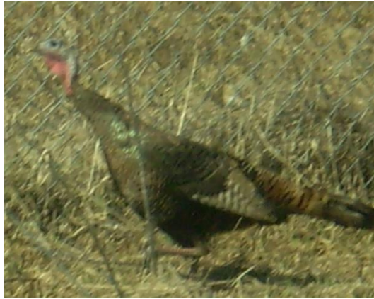
Beautiful wild turkey at the Quarry Lake fence, North Russell.